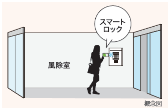
スマートロックに Akerun.M を採用 1

設備面では、スマートフォン等で開錠可能なスマートロック 1 や、EV 充電インフラ 2 、IoT 対応のエアコン・給湯器、宅配ボックス等を導入。共用のエントランスホールにはワークスペースを設けることで、新しい生活様式に対応した住まいを提供いたします。