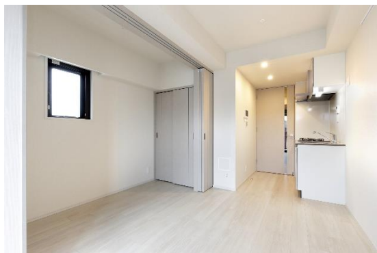
1DK(約 25 m 2 )

住戸は、1DK(約 25 m 2 ) 54 戸、2LDK(約 40 m 2 ・約 50 m 2 ) 32 戸の全 86 戸で構成しております。通常 1R や 1LDK となることが多い 25 m 2 ・40 m 2 住戸についても居室“プラス一部屋”を用意し、LDK (DK) との間仕切りにスライドドアを採用しました。仕事やプライベートに対応できるフレキシブルな間取りとしたことで、ご入居者さまの暮らしのシーンに合わせてご利用いただけます。