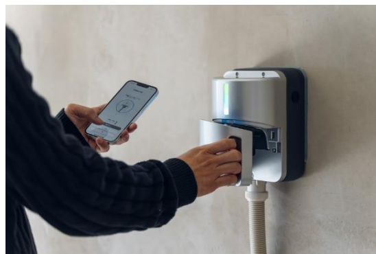
EV 充電インフラに Terra Charge を採用 2

環境面では断熱性能の向上、潜熱回収型給湯器、Low-E 複層ガラス(一部住戸)の採用等により、BELS 認証 3 ★4(一次エネルギー消費量 16%削減)を取得しております。