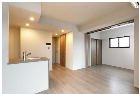
2LDK(約 50 m 2 )

設備面では、スマートフォン等で開錠可能なスマートロック 1 や、EV 充電インフラ 2 、IoT 対応のエアコン・給湯器、宅配ボックス等を導入。共用のエントランスホールにはワークスペースを設けることで、新しい生活様式に対応した住まいを提供いたします。