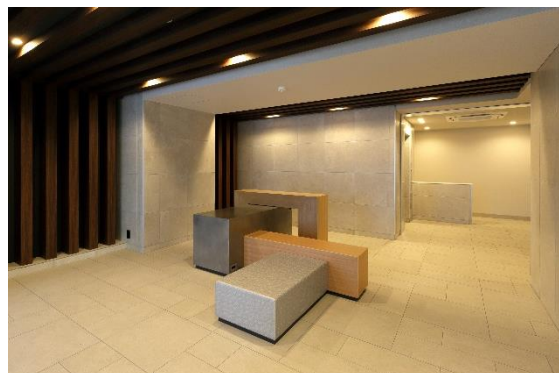
エントランス (内部)